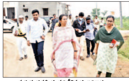
ప్రభుత్వ గృహాలను పరిశీలిస్తున్న అధికారులు