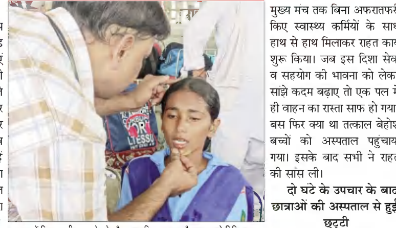
कलायत में जिला स्तरीय समारोह के दौरान प्रभावित छात्रा का वेंकटाप करतें चिकित्सक।