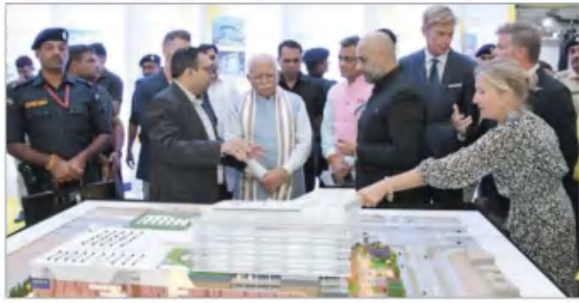
प्रोजैक्ट निर्माण का शुभारंभ करते मुख्यमंत्री मनोहर लाल खट्टर।

हरियाणा के मुख्यमंत्री मनोहर लाल ने मंगलवार को गुरुग्राम में स्वीडन के इंका सेंटर्स के उत्तर भारत में पहले आइकिया 'मिक्सड यूज कॉमर्सियल प्रोजैक्ट का भूमि पूजन कर इसके निर्माण का शुभारंभ किया। लगभग 3500 करोड़ रुपये के निवेश से बनने वाले मिश्रित उपयोग वाले इस आइकिया प्रोजैक्ट का निर्माण गुरुग्राम के सैक्टर-47 में होगा। स्वीडन के भारत में राजदूत श्री कलास मोलिनर भी इस मौके पर उपस्थित रहे। इस अवसर पर उपस्थित जनसमूह को संबोधित करते हुए मुख्यमंत्री मनोहर लाल ने हरियाणा को कम की भूमि, संभावनाओं और समृद्धि की भूमि बताते हुए यहां पर इंका सेंटर्स और आइकिया प्रोजैक्ट का हरियाणा में आने पर स्वागत किया। उन्होंने कहा कि यह प्रोजैक्ट उत्तर भारत तथा इस क्षेत्र के शहकों की जरूरतों को पूरा करने के लिए एक विश्व स्तरीय रिटेल एवं लेजर गणतंत्र होगा। इससे निवेश के साथ-साथ रोजगार और व्यापार