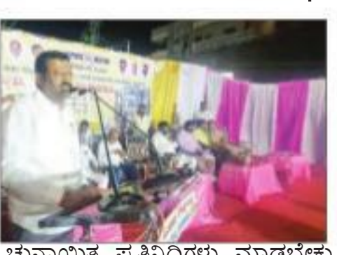
ಜಿಲ್ಲೆಯಲ್ಲಿ ಬೀಜ ಗೊಬ್ಬರದ ಕೊರತೆಯಾದರೂ ಅಧಿಕಾರಿಗಳ ವಿರುದ್ಧ ಕಠಿಣ ಕ್ರಮ ಕೈಗೊಳ್ಳಲಾಗುವುದು. ಕ್ಷೇತ್ರದ ನೀರಾವರಿ ಯೋಜನೆಗಳ ಸಮಸ್ಯೆಗಳನ್ನು

ಕನ್ನಡಪ್ರಭ ವಾರ್ತೆ ಮಸ್ಕಿ ರಾಯಚೂರು ಜಿಲ್ಲೆಗೆ ಜವಳಿ ಘಾಟ್ ನೀಡುವ ಮೂಲಕ 25 ಸಾವಿರ ಉದ್ಯೋಗ ಸೃಷ್ಟಿಗೆ ಕ್ರಮ ಕೈಗೊಳ್ಳುತ್ತೇನೆ ಎಂದು ಜಿಲ್ಲಾ ಉಸ್ತುವಾರಿ ಸಚಿವ ಶಂಕರ ಪಾಟೀಲ್ ಮುನೇನಕೊಪ್ಪ ಭರವಸೆ ನೀಡಿದರು. ಪಟ್ಟಣದಲ್ಲಿ ನಿರ್ಮಿಸಲಾದ ಪುರಸಭೆಯ ನೂತನ ಕಟ್ಟಡ ಹಾಗೂ ಹೈಟೆಕ್ ಗ್ರಂಥಾಲಯ ಉದ್ಘಾಟಿಸಿ ಹಾಗೂ ಅರ್ಜಿ ಪುಲನಾಭವಿಗಳಿಗೆ ಹಕ್ಕು ಪತ್ರಗಳನ್ನು ವಿತರಿಸಿ ಮಾತನಾಡಿದ ಸಚಿವರು, ಕೇಂದ್ರ ಹಾಗೂ ಸರ್ಕಾರದ ಯೋಜನೆಗಳು ಕಟ್ಟಕಡೆಗೆ ವ್ಯಕ್ತಿ ತಲುಪಿಸುವ ಕೆಲಸ