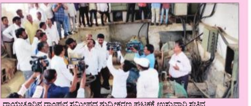
ರಾಯಚೂರಿನ ರಾಜ್ಯ ಸಮೀಪದ ಶುದ್ಧೀಕರಣ ಘಟಕಕ್ಕೆ ಉಸ್ತುವಾರಿ ಸಚಿವ ಮುನೇನಕೊಪ್ಪ ಭೇಟಿ ನೀಡಿ, ಅಲ್ಲಿಯ ನೀರನ್ನು ಕುಡಿದು ಪರಿಶೀಲಿಸಿದರು.