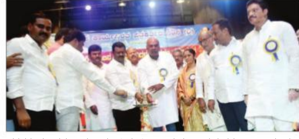
ಪತ್ರಕರ್ತರ ಸಮಾಜದ ಆತ್ಮಸಾಕ್ಷಿಯಾಗಿ ನಿಲ್ಲಬೇಕು. ಜನಸಾಮಾನ್ಯರಿಗೆ ಸತ್ಯದ ವರದಿಗಳನ್ನು ಮಾಡಬೇಕು ಎಂದು ಸಚಿವರು ಹೇಳಿದರು.