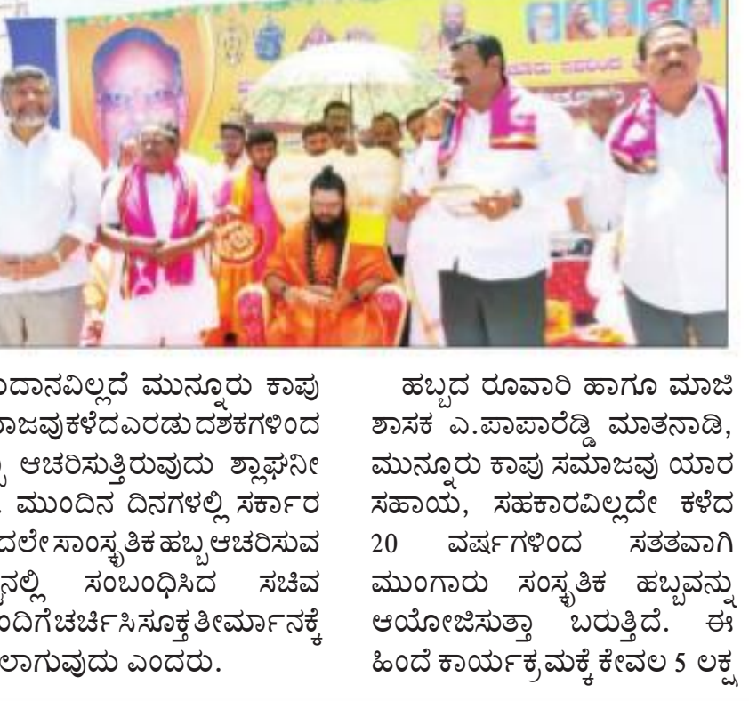
ಅನುದಾನವಿಲ್ಲದ ಮುನ್ನೂರು ಕಾಪ್ಪ ಸಮಾಜದವುಳೆರವರದೇಶಕ್ತಿಯಿಂದ ಹಬ್ಬ ಆಚರಿಸುತ್ತಿರುವುದು ತಿಳಿಸಿದರು. ಮುಂದಿನ ದಿನಗಳಲ್ಲಿ ಸರ್ಕಾರದಿಂದಲೇ ಸಾಂಸ್ಕೃತಿಕ ಹಬ್ಬ ಆಚರಿಸುವ ನಿಟ್ಟಿನಲ್ಲಿ ಸಂಬಂಧಿಸಿದ ಸಚಿವ ರೊಂದಿಗೆ ಚರ್ಚಿಸಿ ಸೂಕ್ತ ಚರ್ಮನಕ್ಕೆ ಬರಲಾಗುವುದು ಎಂದು.