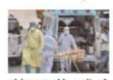
कोरोनामुक्त होने वालों की संख्या बढ़कर 4.24 करोड़ हो गई। इस बीच सक्रिय मामलों में 2,269 को गिरावट आने के साथ ही इनकी संख्या अब 42,219 रह गई है।

नई दिल्ली, 11 मार्च (एजेंसियां)। देश में कोरोना संक्रमण के मामलों में लगातार गिरावट के बीच पिछले 24 घंटों में इस बीमारी से 255 मरीजों की मौत हो गई जबकि इससे एक दिन पहले यह संख्या 104 थी।