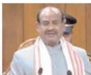
अकेले अपनी सभी समस्याओं का समाधान नहीं कर सकता कोई भी देश : ओम बिरला

नई दिल्ली, 11 मार्च (देशबन्धु)। लोकसभा अध्यक्ष ओम बिरला ने कहा है कि कोई भी देश अकेले अपनी सभी समस्याओं का समाधान नहीं कर सकता तथा विश्व शांति और विकास के लिए सभी देशों को मिलकर सामूहिक कार्रवाई करने की आवश्यकता है।